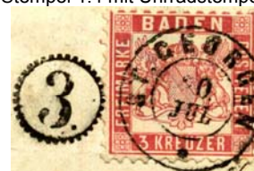
Stempel 1.4 mit Uhrradstempel

So lange es pro Tag nur einen Postabgang gab, genügte das Datum zur Laufzeitkontrolle noch ohne Stundenangabe. Besonders mit dem Bau der Eisenbahnen war es aber ohne Schwierigkeiten möglich geworden, an vielen Orten mehrere Postabgänge täglich einzurichten, so dass man wiederum zur Überwachung der Laufzeiten auch die Uhrzeit heranzog. Form, Aussehen und Größe des Stempels waren noch nicht genormt; noch zur badischen Zeit kam es zu einem Einkreisstempel; auch er war wiederum ein Einstecktypenstempel, dessen Uhrzeit-Stecktypen sogar mehrmals täglich ausgetauscht werden mussten. Die Uhrzeit wurde 12stündig angegeben und zur Unterscheidung mit "V" für Vormittag und "N" für Nachmittag ergänzt. Bei späteren Stempeln kam auch noch die Jahreszahl hinzu.