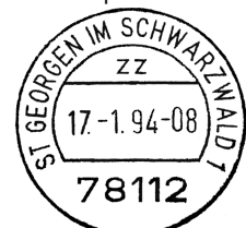
Ub zz 17.01.1994 - 22.12.1994