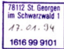
Stempel 3.3.6.10 17.01.1994 – 31.07.1994

Die erste Agentur in St. Georgen wurde am 17. Januar 1994 eröffnet, also gleich nach der Schließung des Postamts 2 am Rupertsberg. Sie war im Edekgeschäft Hammer auf der Seebauernhöhe etabliert. Zunächst war die Agentur bei der Eröffnung mit zwei Stempeln ausgerüstet, davon einem Rechteckstempel aus Gummi. Er zeigt in den beiden oberen Zeilen die PLZ und das leitende Postamt; die dritte zeigt das Datum, das von Hand eingetragen werden musste. Die vierte Zeile schließlich weist eine postalische Kennzahl auf, die sich wie folgt zusammensetzt: