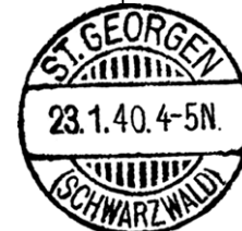
Einkreisstempel ohne Ub; 12Stundenzeit je 10 Gitterstäbe ou 26.07.1938 – 31.12.1955