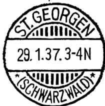
Einkreisstempel je 10 Gitterstäbe ou 12Stundenzeit bu je ein Stern re u.li 08.06.1896 – 25.05.1938