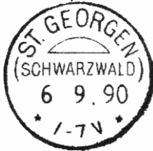
Einkreisstempel mit Segment oben 10.09.1884 – 02.04.1896

Die Entwicklung verlief aber nicht geradlinig. Für St. Georgen führte sie zu einem Einkreisstempel mit Segment oben; als einziges Charakteristikum, das der Verfügung vom 22. Mai 1875 entsprach, erscheinen die zwei Ziersterne im Bogen unten rechts und links von der Uhrzeit. Technisch gesehen handelt es sich immer noch um einen Steckstempel.