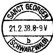
Einkreisstempel Ub b; 12Stundenzeit 09.11.1919 – 21.02.1938