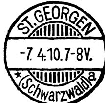
Einkreisstempel je 12 Gitterstäbe ou 12Stundenzeit bu links Stern rechts Ub a 18.10.1903 – 07.04.1920

Das äußere Erscheinungsbild änderte sich in diesem Zusammenhang auch; es wurde durch einen breiten waagrechten Mittelsteg gekennzeichnet. Diese sogenannten Einkreisstempel bestimmten das Bild bis in die 30er Jahre, teilweise sogar bis nach dem 2. Weltkrieg um 1950. Manche enthalten Gittersegmente, nicht zur Dekoration, sondern aus technischen Gründen. Sie kommen oben und/oder unten vor, entweder mit zehn oder zwölf Stäben je Segment, was als Unterscheidungsmerkmal vom Sammler herangezogen werden kann. Zum anderen bleiben